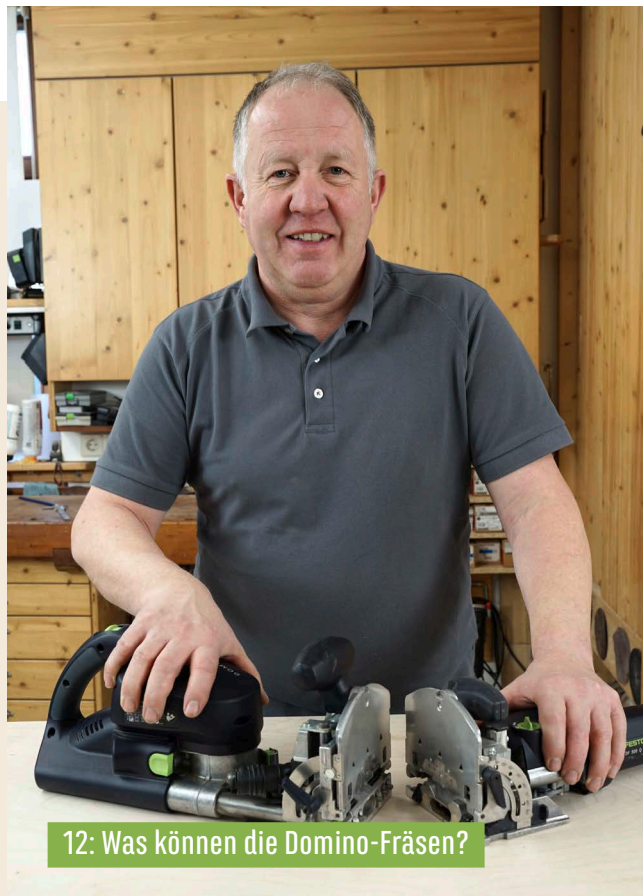
12: Was können die Domino-Fräsen?