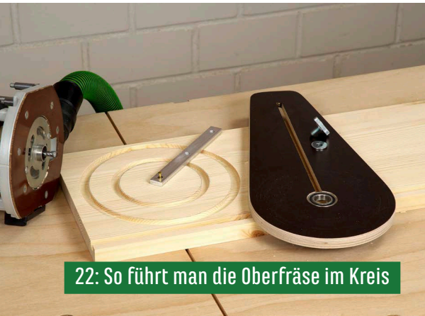
22: So führt man die Oberfräse im Kreis