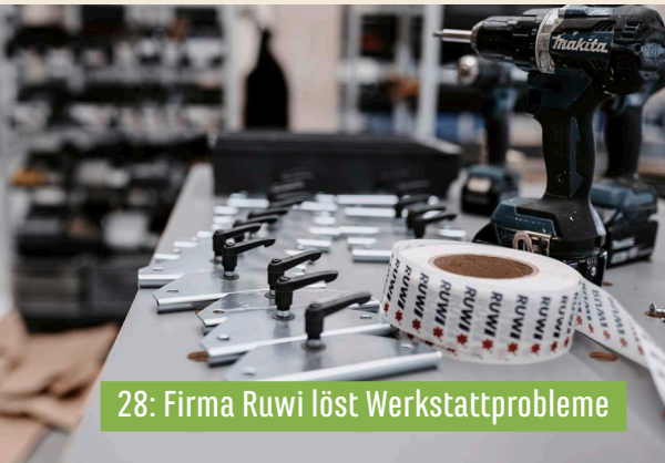
28: Firma Ruwi löst Werkstattprobleme