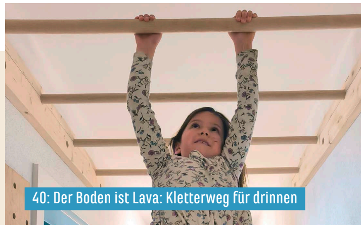
40: Der Boden ist Lava: Kletterweg für drinnen