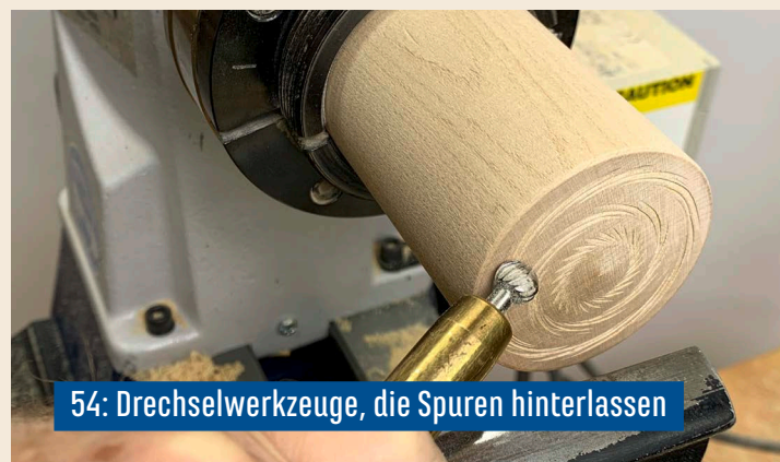
54: Drechselwerkzeuge, die Spuren hinterlassen