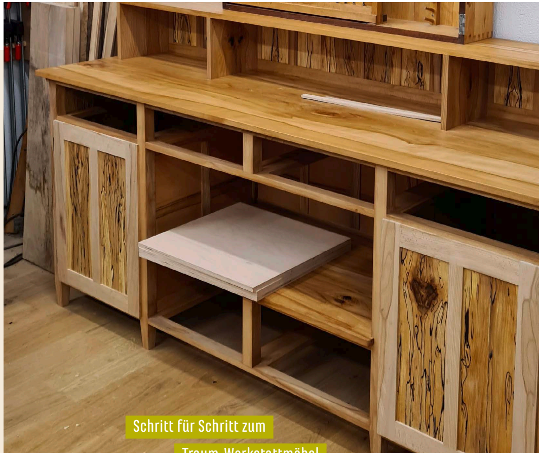
Schritt für Schritt zum