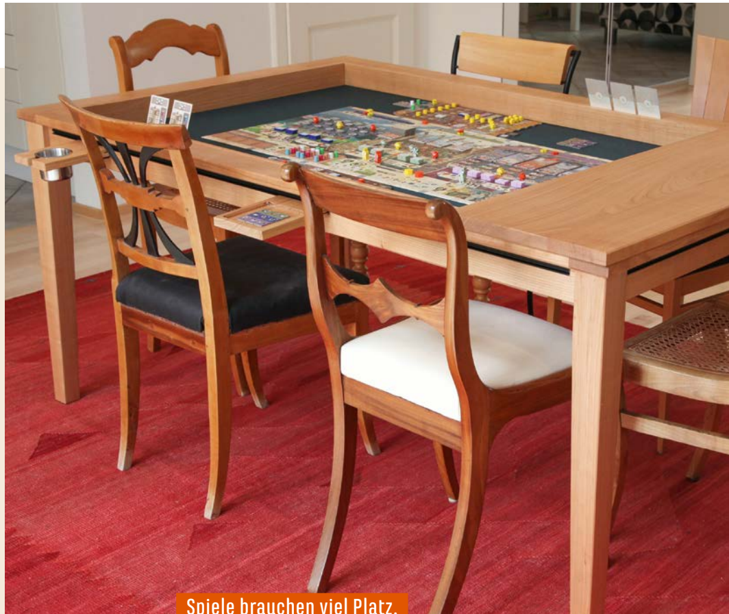
Spiele brauchen viel Platz.