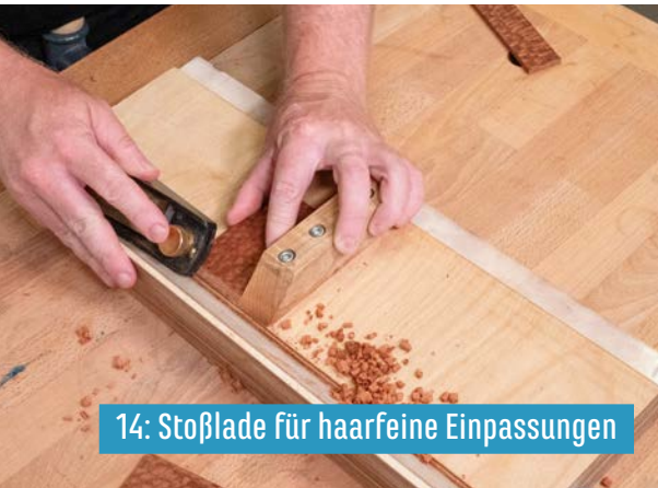
14: Stoßlade für haarfeine Einpassungen