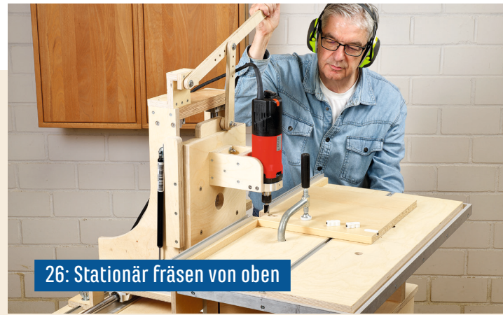
26: Stationär fräsen von oben