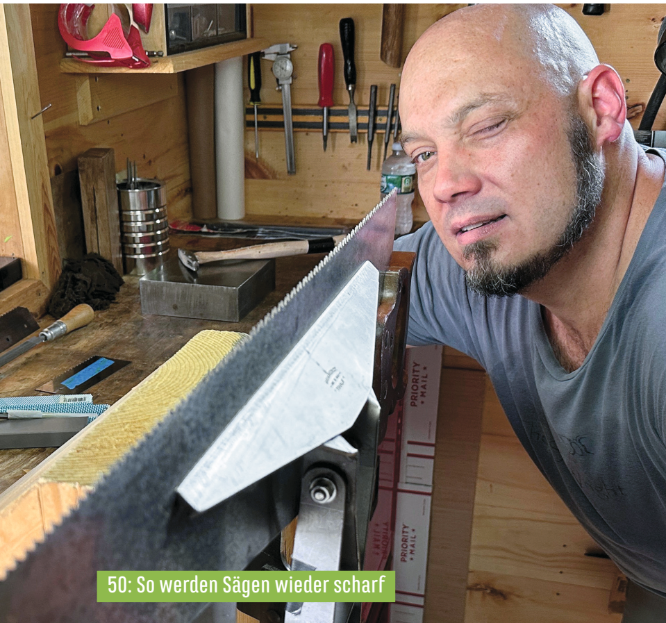
50: So werden Sägen wieder scharf