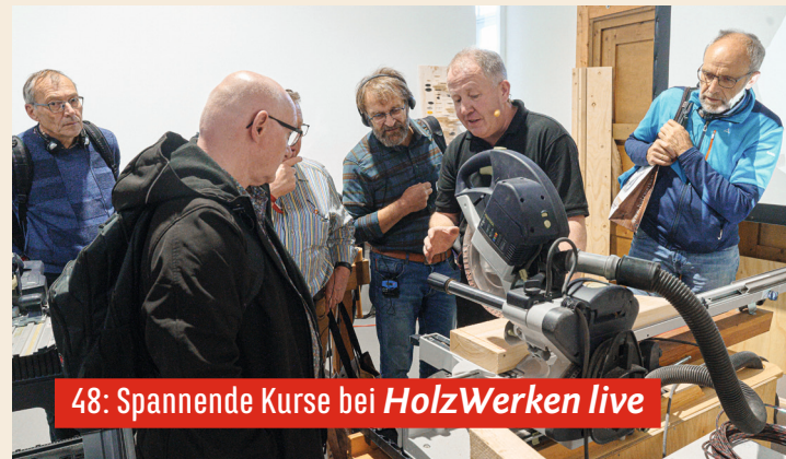
48: Spannende Kurse bei HolzWerken live