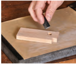
79 Führungen ausrichten