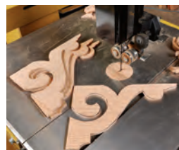
184 Besondere Techniken