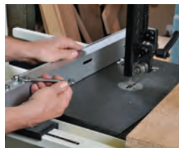
117 Verlaufende Schnitte