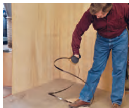
52 Umgang mit Sägeblättern