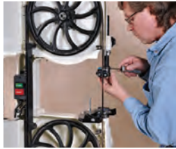
81 Führungen auswechseln