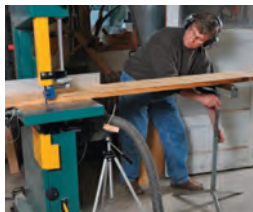
84 Der Arbeitsplatz