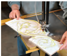
91 Der sichere Stand