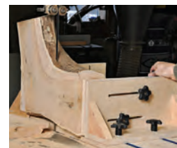
191 Stammware einschneiden