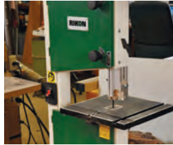
7 Typen von Bandsägen