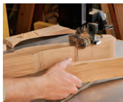
172 Sägen von zusammen- gesetzten Werkstücken