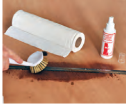
66 Reinigung der Sägeblätter