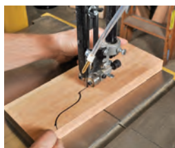
157 Zusammengesetzte Kurven