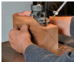
93 Sicherer Vorschub