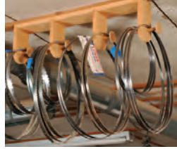
66 Lagerung der Sägeblätter