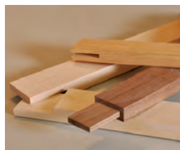
177 Zapfen herstellen