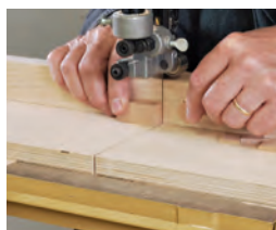
127 Zwei wichtige Vorrichtungen