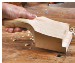
112 Schiebestöcke- und klötze