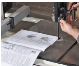
82 Wie die eigene Westentasche