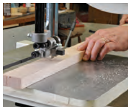
115 Grundlegende Schnitte