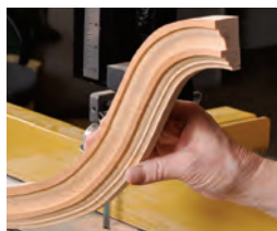
174 Gebogenen Profilleisten