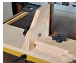
119 Die Verwendung von Anschlägen