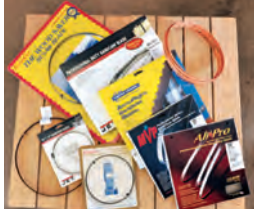
54 Terminologie des Bandsägeblattes