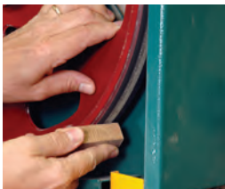
50 Instandsetzung der Rollen