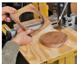
150 Kreise und Kreisbögen