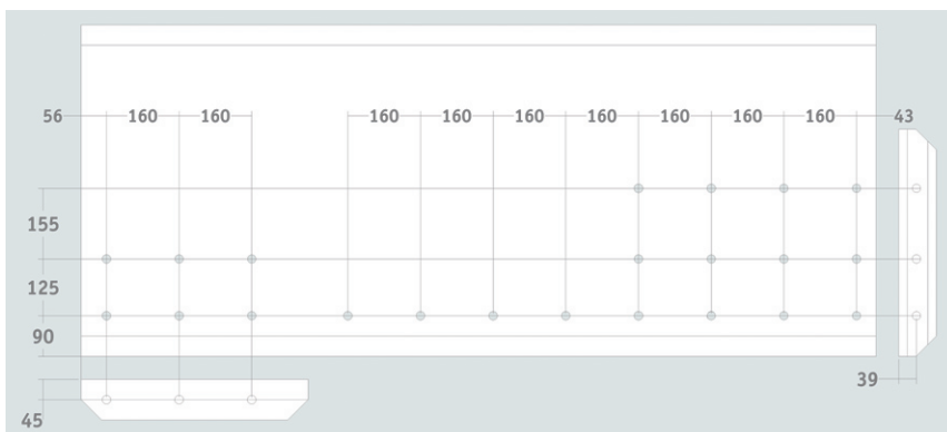
Bohrbild der Bankplatte in der Draufsicht

Wenn die Hobelbank montiert ist, wird die Bankplatte abgerichtet. Sie haben so eine weitgehend plane Referenzfläche in Ihrer Werkstatt. Das ist für viele Arbeiten eine enorme Hilfe. Wenn Sie sich diesen Arbeitsschritt noch nicht zutrauen, sollten Sie die Platte erst einmal nur gleichmäßig abschleifen. Sie können zu jedem späteren Zeitpunkt die Platte noch abrichten. Schleifen Sie nicht zu fein, denn auf einer zu glatten Fläche