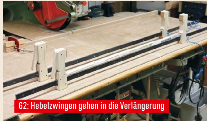
62: Hebelzwingen gehen in die Verlängerung