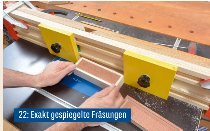
22: Exakt gespiegelte Fräsungen