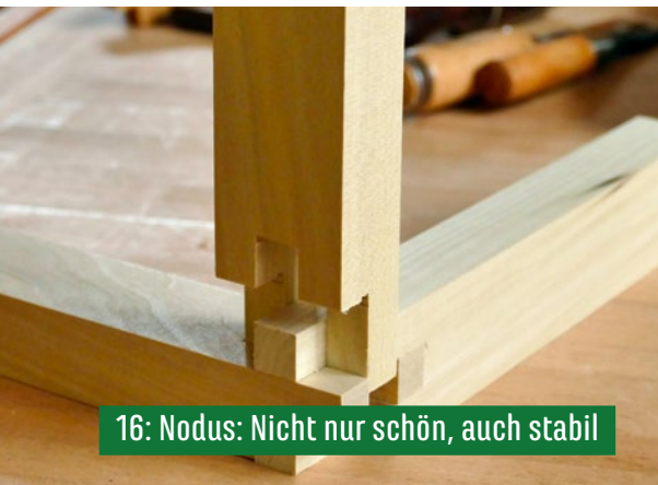
16: Nodus: Nicht nur schön, auch stabil