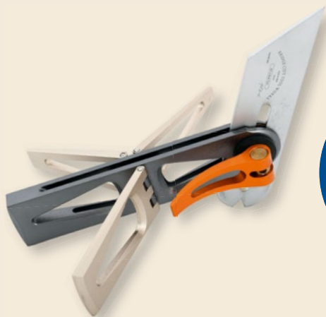
Edel bemessen: Bridge City Multitool MT-2 im Test