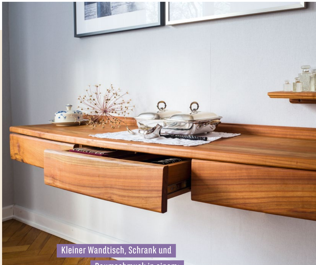
Kleiner Wandtisch, Schrank und Raumschmuck in einem: Dieses frei hängende Schränkchen ist ein echter Hingucker – und bietet viel Platz und Ablagemöglichkeiten