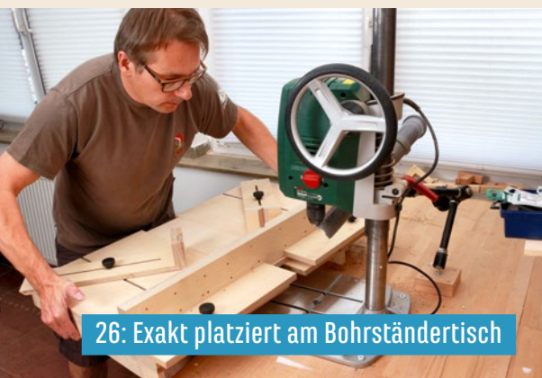
26: Exakt platziert am Bohrständertisch